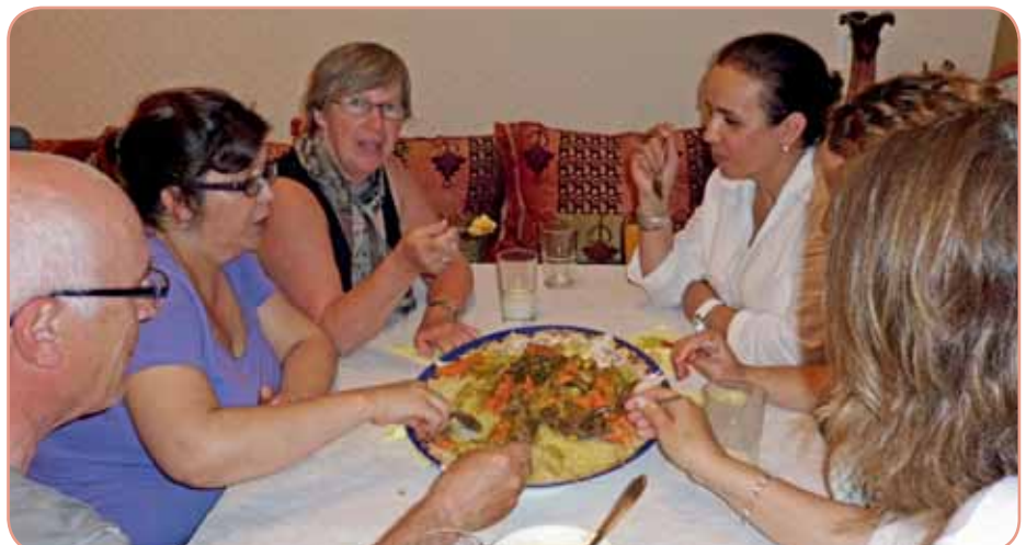
Couscous, smakelijk eten!

De volgende multicultikookclub is op vrijdag 27 januari in De Bakkerij. Het concept van de kookclub is eenvoudig: Samen inkopen doen voor de maaltijd en zo elkaars ingrediënten, winkels, gewoontes en gebruiken leren kennen. Vervolgens koken en samen eten. Wie mee wil eten is welkom tussen 18.30 en 19.00 uur. Aan tafel ontwikkelen zich vaak leuke en informatieve gesprekken! De hoofdelijk omgeslagen kosten bedragen niet meer dan € 10,00 per persoon. Na afloop wordt afgesproken wie de volgende keer kookt. Opgeven vóór 20 januari via multicultikoken@hotmail.nl