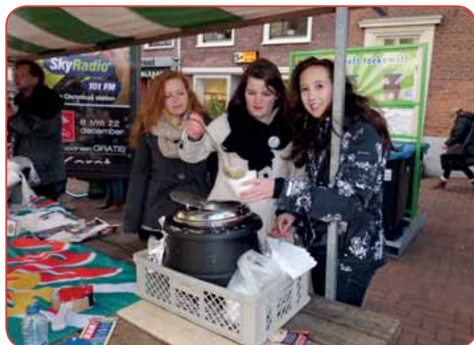
In de snertkraam.

daarmee invulling gaven aan hun maatschappelijke stage en zich inzetten door positieve aandacht te geven aan dak- en thuislozen. Samen stonden ze in een markt kraampje bij de Hartebrugkerk. Het