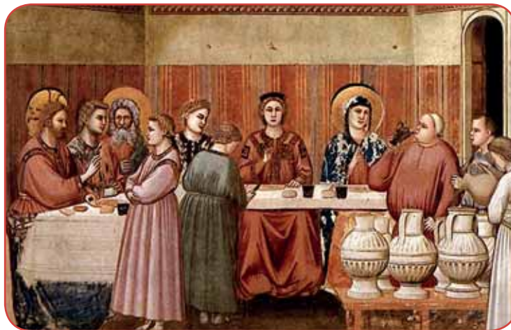
Foto: Fresco 'De Bruiloft van Kana' in Cappella Scrovegni (Padua), Giotto di Bondone, 1304-1306

Dit verhaal staat in het evangelie van Johannes 2:1-12. Jezus was in het dorp Kana in Galilea te gast op een bruiloft. Toen daar de wijn opgebraakt was,